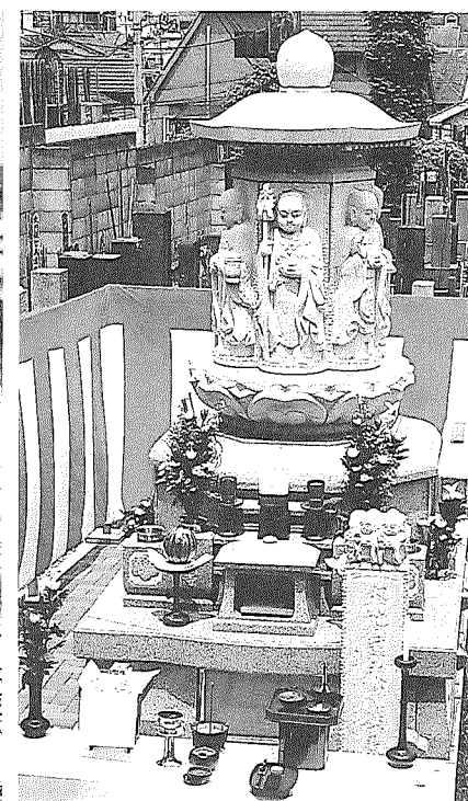
「六地蔵永代供養塔」東京都中野区・宗清寺