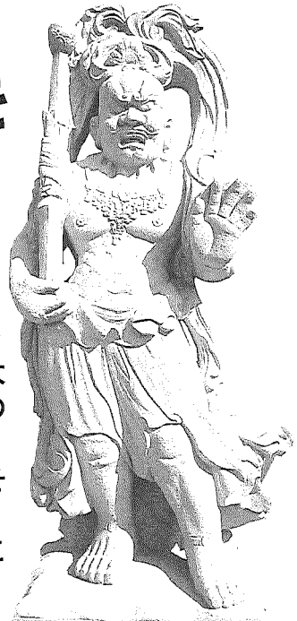
天衣と本体と岩座が1つ石で高さ10尺 阿形金剛力士(仁王像)東京都武蔵野市・延命寺

「仏の持つ内面的な慈悲心」の表現など、独自の世界観を感じさせる作風で高い評価を得ている長岡和慶師。これまでに手がけた石仏は600余体、石彫刻の分野では初めての「大仏師」(*)の称号を三井寺と三千院より、兄・長岡瀬山師と共に授かっている。その作品は全国の著名寺院等に収められているだけでなく、人類の偉大な遺産を集めた世界最大規模ともいわれるイギリス・ロンドンの大英博物館に五体の石仏と制作工程の写真・デッサン画等約1万5000点を収蔵。さらにドイツで仏像展を一ヶ月間開くなど、その活動領域は日本国内に留まらない。