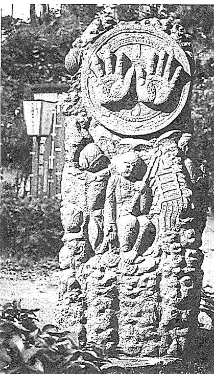
「仏手とハタ持ち地蔵」愛知県豊田町・三ヶ根観音太山寺