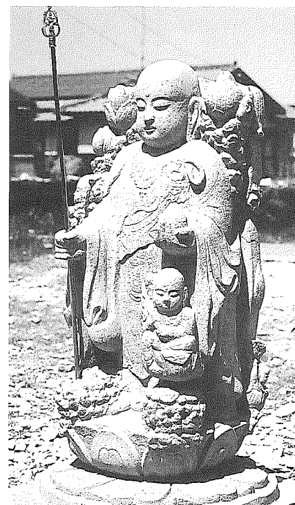
地蔵菩薩立像と雲中菩薩 京都市・総本山泉涌寺(皇室菩提寺)