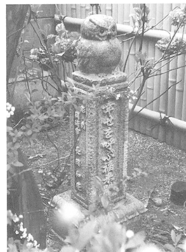
「幸せを呼ぶ福来路」雨にぬれた花沢石 本体H21.2×W13.3×D12.4 愛知県の小島宅に建立