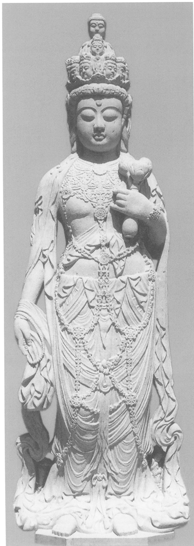
「十一面観音菩薩立像」愛知県の額田中目石 H404.5×W139.3×D78.7 愛知県西尾市の浄名寺に本体4m同像建立